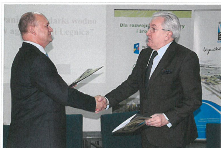
Podpisanie umowy między LPWiK i WFOŚiGW