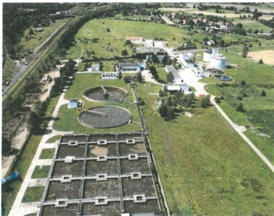
► W Zakładzie Oczyszczania Ścieków przy ulicy Spokojnej w Legnicy, do czerwca 2015 roku, zostanie wybudowana suszarnia osadów ściekowych. Zgodnie z unijną dyrektywą, już w 2015 roku nie będzie można składować powstających osadów. Zastąpi je utylizacja