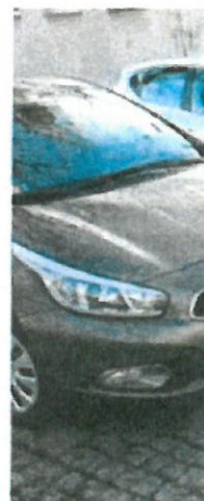
► Lubinscy policjanci radiowozów. Korzy:

Ponad 330 tysięcy złotych zakup pięciu diwozów dla Komendy Powiatowej Policji w Lubinie. Władze i samorząd w Lubinie w połowie z pieniędzy budżetowych a w połowie z pieniędzy budżetowych i kazały na ten cel 115 tysięcy. Samochody s binie.