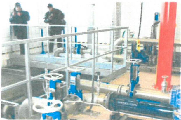
► Osady z legnickiej oczyszczalni trafiają teraz do cementowni